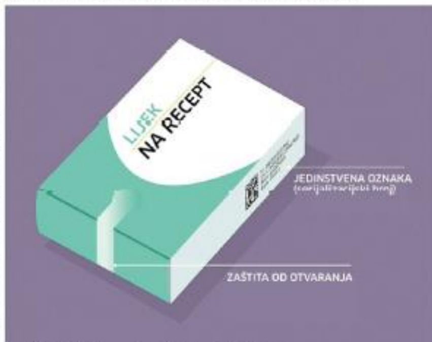
Oznake koje lijekovi moraju imati od 9. veljače 2019. godine

– Svaki lijek koji se izdaje na recept, a koji se od 9. veljače 2019. puti u promet, na svojoj kutijici mora imati zaštitu od otvaranja i jedinstvenu oznaku, odnosno serijalizacijski broj na