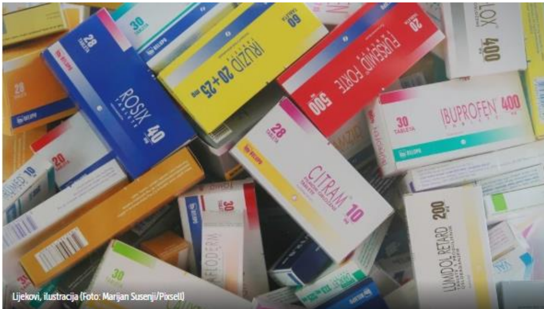
Lijekovi, ilustracija

U Hrvatskoj je danas počela Serijalizacija lijekova, odnosno provjera autentičnosti lijekova na recept, kojim će se spriječiti izdavanje krivotvorenih lijekova kroz legalni lanac opskrbe, priopćeno je u subotu iz Hrvatske organizacije za provjeru autentičnosti lijekova (HOPAL).