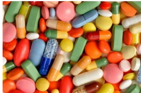
Svaki drugi lijek kupljen u Hrvatskoj preko interneta je - krivotvorina

»U suradnji sa svim dionicima uspjeli smo ispuniti visoke zahtjeve složenog informatičkog sustava i na vrijeme izgraditi platformu koja omogućuje povezanost s Europskim središtem za provjeru autentičnosti lijekova (EMVS). Podatci o proizvodima i pakiranjima lijekova koji se prikupljaju u EU sustavu, dostupni su i u Nacionalnom sustavu za provjeru autentičnosti lijekova, koji je od danas u potpunosti spreman i funkcionalan te je započeo s primjenom«, navode iz HOPAL-a.